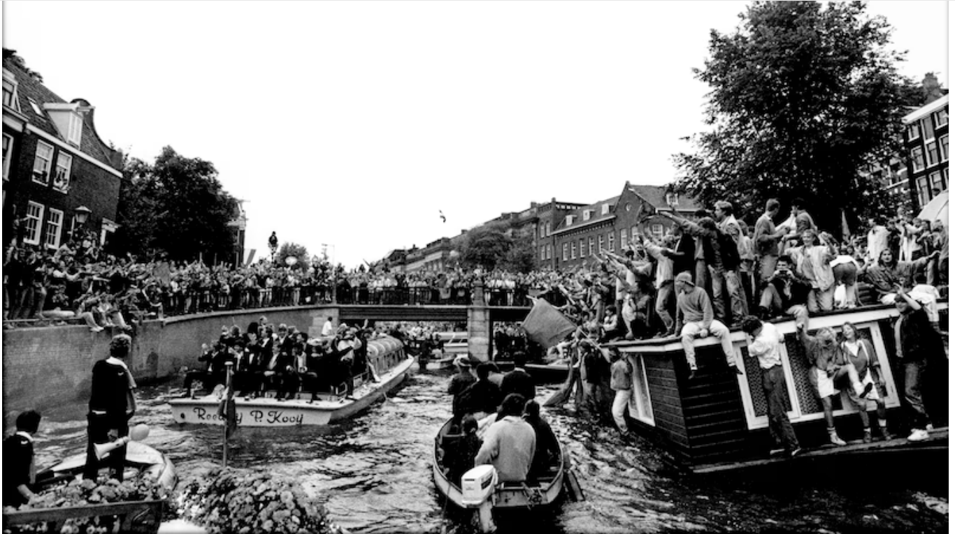
▲ Inhoudiging Nederlands Eftal, Europees Kampioen, 1988